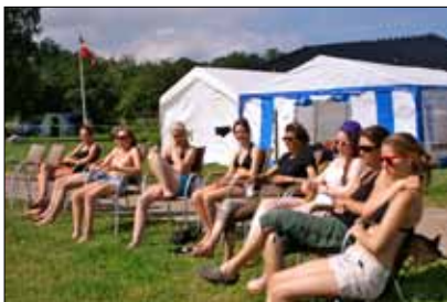
Tilskuere til rideundervisning nyder det skønne vejr

Dagen efter var afslutningsdagen. Det havde ellers været fantastisk shorts og g-strengsandals vejr alle dage, men ikke den sidste dag. Det var mere gummi-støvlevejrs. Men vi afholdt et afslutningsstævne på trods af vejret. Og heldigvis var der stadig søde og opbyggende forældre der ville hjælpe, selvom de lignede druknede mus. Alt i alt var det en skøn start på sommerrferien, og et fantastisk sted at placere en ridelejr, var da netop på det sted. Og jeg vil da gerne sige at mine sommerferieplaner for næste år i første uge af sommerferien, klart er en ridelejr mere.