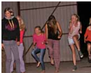
Diskotek og dans i laden

Da vi kom hjem flyttede vi alle vores ting fra teltene over i laden fordi det skulle blive regnvejrs om natten. Da vi havde hørt gyseren Johnny 3 gange, var der stemning for lidt dans og det gjorde vi med stor stil.